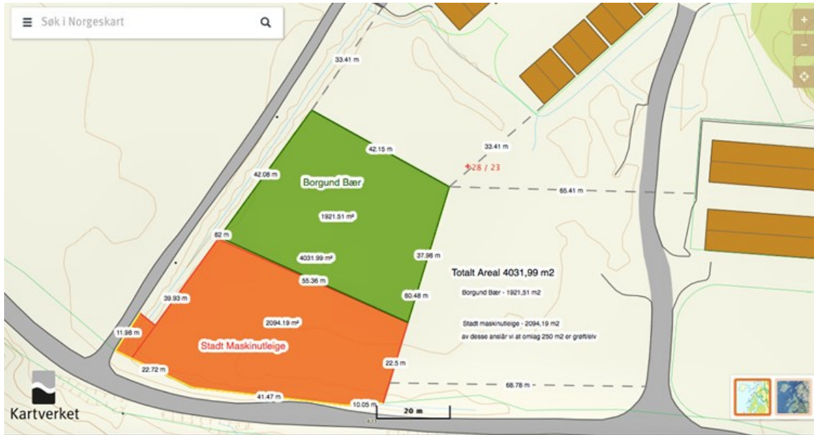
Kart 2: Alternativ 2

dei måtte ta kostnaden med å opparbeide «bru» over kanalen vest for tomta.